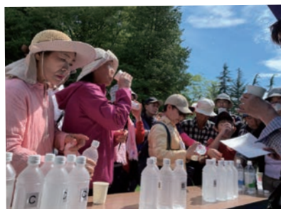
蟹沢浄水場の水はどれかな？

八戸公園をスタートし、草木の香りと木漏れ日の美しい小道を歩き、普段は立ち入りできない水源地や蟹沢浄水場などの水道施設を見学しました。