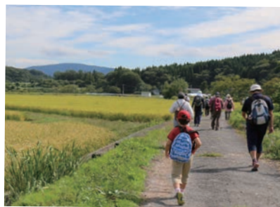
秋の訪れを感じながら歩きます

また、水源地では、この日限りの流しそうめん車に改良された給水車が迎えるお楽しみ演出も！水道管を縦半分にした台を、冷たい水とそうめん、大小さまざまな朝摘みトマトが流れると、大人も子供も夢中ですくっていました。3種類の水道水を当てるきき水クイズでは4名が正解。