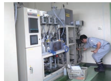
水質自動監視装置の点検