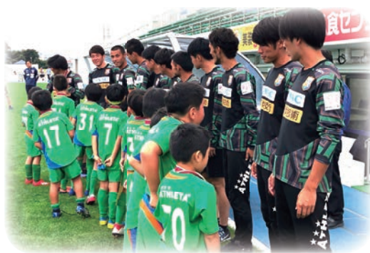
多くのイベントで子供たちと交流

今の時代、子どもたちには様々な選択肢があり、いろいろな将来が広がっているが、育成組織の子どもたちには、夢を持つことの大切さを伝えている。