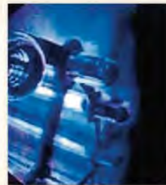
紫外線装置内部のようす

装置内には蛍光灯のようなランプが配置されています。これが発光し、紫外線を照射することで水を消毒します。