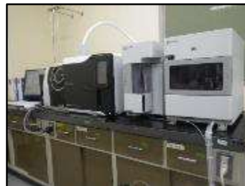
▲パージ・トラップ-ガスクロマトグラフ質量分析計 （揮発性有機化合物・かび臭原因物質の分析）