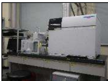
▲誘導結合プラズマ質量分析計 （金属類の分析）