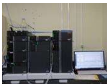
▲ポストカラム-イオンクロマトグラフ （臭素酸の分析）