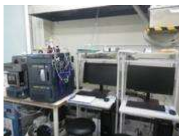
▲液体クロマトグラフ質量分析計 （ハロ酢酸類、有機フッ素化合物の分析）