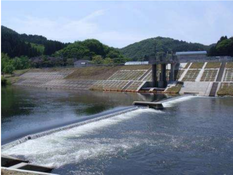
是川ポンプ場（取水堰）